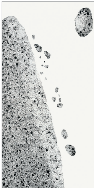
Wide open No6, 2014, Tusche auf Papier, 138 x 69 cm

Mi–Fr 12–18, Sa 10–16 und nach Vereinbarung